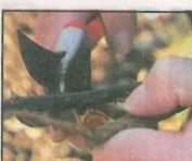
OVER KNOPPEN: Skjær på skrå like over en knopp.