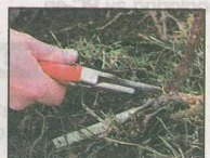
FRISERING: Buskrosen må friseres og døde grener klippes vekk.