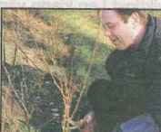
KLIPP NED: Buskrosen skal skjæres ned til halv lengde.